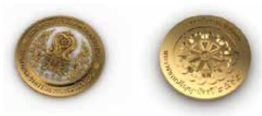
ภาพที่ ๒ เข็มวิทยฐานะสถาบันการอาชีวศึกษา

เข็มวิทยฐานะ มีลักษณะเป็นรูปตราสถาบัน ทำด้วยโลหะดุนนูน ลงยาสีขาว ขอบเป็นโลหะลงยาสีทอง เส้นผ่าศูนย์กลาง ๓.๘ เซนติเมตร