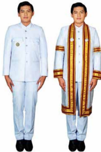
ภาพที่ ๓ การแต่งกายของบัณฑิตชายทั่วไป