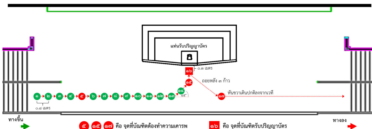
๑๕ ๑๔ ๑๓ คือ จุดที่บัณฑิตต้องทำความเคารพ ๑๖ คือ จุดที่บัณฑิตรับปริญญาบัตร

๙.๔ จุดทำความเคารพ ครั้งที่ ๓ เมื่อบัณฑิตถอยหลังออกมา ๓ ก้าว จะถึงจุดทำความเคารพ ครั้งที่ ๓ บัณฑิตทำความเคารพ ครั้งที่ ๓