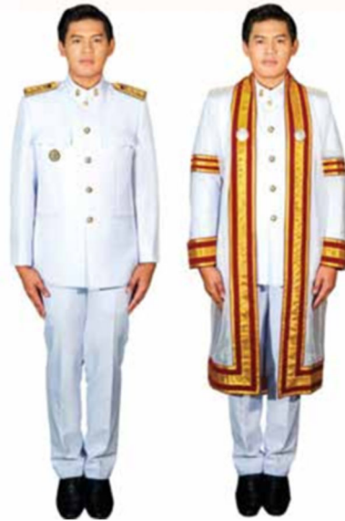
ภาพที่ ๔ การแต่งกายของบัณฑิตชายที่เป็นข้าราชการ หรือพนักงานของรัฐ

๒.๑.๓ บัณฑิตชาย ที่เรียนจบนักศึกษาวิชาทหาร แต่งกาย ดังนี้