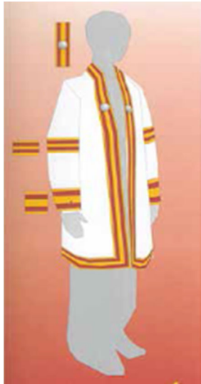
ภาพที่ ๑ ครุยวิทยฐานะสำหรับผู้ได้รับปริญญาตรีสถาบันการอาชีวศึกษา

๑.๒ สำรดต้นแขน พื้นสำรดทำด้วยผ้าสักหลาดสีแดงเลือดหมู กว้าง ๖.๕ เซนติเมตร มีแถบสีทองกว้าง ๑ เซนติเมตร ที่ริมทั้งสองข้างตอนกลางมีสำรดแถบสีทองกว้าง ๑.๓ เซนติเมตร