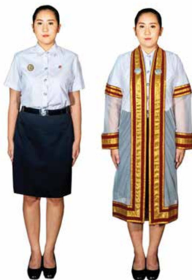
ภาพที่ ๖ การแต่งกายของบัณฑิตหญิงทั่วไป

๙) เข็มวิทยฐานะติดที่หน้าอกด้านขวา และสวมครุยวิทยฐานะทับเครื่องแต่งกาย