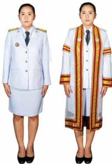
ภาพที่ ๗ การแต่งกายของบัณฑิตหญิงที่เป็นข้าราชการหรือพนักงานของรัฐ