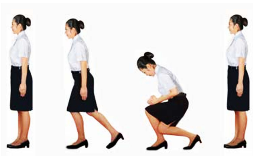
ภาพที่ ๑๑ การทำความเคารพและการถวายความเคารพของบัณฑิตหญิง

บัณฑิตหญิงและบัณฑิตหญิงที่เป็นข้าราชการแต่งเครื่องแบบพิธีการปกติขาว ให้ทำความเคารพหรือถวายความเคารพ ทั้งการถวายความเคารพหลังเพลงสรรเสริญพระบารมีจบ การทำความเคารพผู้แทนพระองค์ และการทำความเคารพในการรับปริญญาบัตรโดยการถอนสายบัวแบบพระราชนิยม และปฏิบัติตามขั้นตอนดังนี้ ยืนตรง เท้าชิด ใช้เท้าขวาเป็นหลัก ชักเท้าซ้ายไปทางด้านหลังของเท้าขวาที่ยืนอยู่ ย่อตัวให้ต่ำลงช้า ๆ แต่อย่าให้ถึงพื้น ขณะที่ชักเท้าซ้ายให้ยกมือทั้งสองข้างวางประสานกันบนหน้าขาเหนือเข่า ใช้มือขวาทับมือซ้าย ค้อมตัวเล็กน้อยทอดสายตาดตรง เสร็จแล้วยืนตรง มือแนบข้างลำตัว