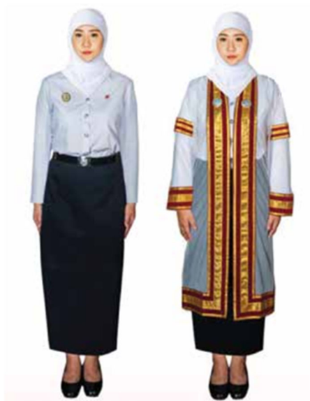
ภาพที่ ๙ การแต่งกายของบัณฑิตหญิงมุสลิม