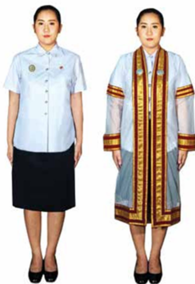
ภาพที่ ๘ การแต่งกายของบัณฑิตหญิงมีครรรภ์

๒.๒.๔ บัณฑิตหญิง ที่นับถือศาสนาอิสลาม แต่งกายประกอบชุดฮิญาบ ดังนี้