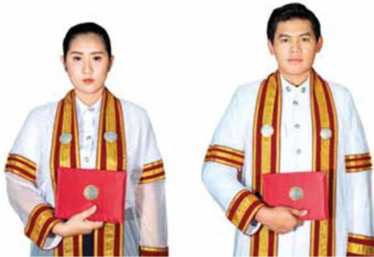
ภาพที่ ๑๔ การเชิญปริญญาบัตร

เมื่อบัณฑิตรับปริญญาบัตรมาแล้ว ให้เชิญปริญญาบัตรในท่าที่ถือไว้แนบกับอก ปกปริญญาบัตรด้านที่มีตราสถาบันอยู่ด้านนอก ข้อศอกแนบลำตัวอยู่ตลอดเวลา จนกว่าจะเข้านั่งประจำที่ของตน เมื่อถึงที่นั่งแล้ว ให้ทำความเคารพและนั่งลง และเมื่อยืนขึ้นกล่าวคำปฏิญาณตน หรือรับโอวาท หรือยื่นรอส่งผู้แทนพระองค์ และทำความเคารพขณะผู้แทนพระองค์ออกจากห้องพิธี บัณฑิตจะต้องเชิญปริญญาบัตรไว้แนบอกเสมอ