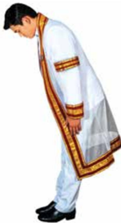
ภาพที่ ๑๐ การทำความเคารพและถวายความเคารพของบัณฑิตชาย

ทำความเคารพและการถวายความเคารพโดยการคำนับ ทั้งการถวายความเคารพหลังเพลงสรรเสริญพระบารมีจบ การทำความเคารพผู้แทนพระองค์ และการทำความเคารพในการรับปริญญาบัตร โดยปฏิบัติตามขั้นตอน ดังนี้ ยืนตรง เท้าชิด ปลายเท้าแยกออกพองาม มือทั้งสองข้างแนบลำตัว ค้อมลำตัวพอประมาณ พร้อมก้มศีรษะลง สายตาอยู่ในระดับกระดูกสันหลังที่สอง แล้วตั้งศีรษะโดยเงยหน้าขึ้นช้า ๆ พร้อมตั้งลำตัวจนตั้งอยู่ในท่าตรง