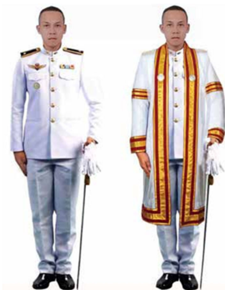
ภาพที่ ๕ การแต่งกายของบัณฑิตที่เรียนจบนักศึกษาวิชาทหาร