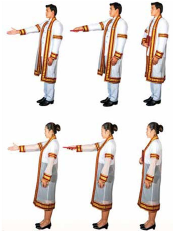
ภาพที่ ๑๓ การรับปริญญาบัตรจากผู้แทนพระองค์

จังหวะที่ ๓ ดึงมือกลับ พร้อมเชิญปริญญาบัตรมาแนบไว้กับอก โดยให้ปกปริญญาบัตรด้านที่มีตราสถาบันอยู่ด้านหน้า ข้อศอกขวาแนบลำตัว