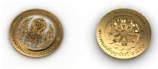
ภาพที่ ๒ เข็มวิทยฐานะสถาบันการอาชีวศึกษา

เข็มวิทยฐานะ มีลักษณะเป็นรูปตราสถาบัน ทำด้วยโลหะดุนนูน ลงยาสีขาว ขอบเป็นโลหะลงยาสีทอง เส้นผ่าศูนย์กลาง ๓.๘ เซนติเมตร