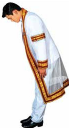
ภาพที่ ๑๐ การทำความเคารพและถวายความเคารพของบัณฑิตชาย

ทำความเคารพและการถวายความเคารพโดยการคำนับ ทั้งการถวายความเคารพหลังเพลงสรรเสริญพระบารมีจบ การทำความเคารพผู้แทนพระองค์ และการทำความเคารพในการรับปริญญาบัตร โดยปฏิบัติตามขั้นตอน ดังนี้ ยืนตรง เท้าชิด ปลายเท้าแยกออกพองาม มือทั้งสองข้างแนบลำตัว ค้อมลำตัวพอประมาณ พร้อมก้มศีรษะลง สายตาอยู่ในระดับกระดูกสันหลังที่สอง แล้วตั้งศีรษะโดยเงยหน้าขึ้นช้า ๆ พร้อมตั้งลำตัวจนตั้งอยู่ในท่าตรง