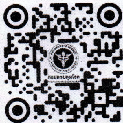
QR code ลงนามปฏิญาณตน